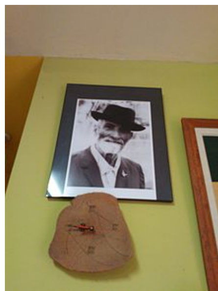
Un rincón del ecomuseo dedicado a Panchito.