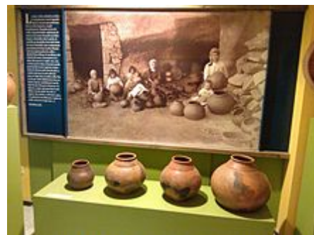
Sala temática del ecomuseo "Casa-Alfar Panchito", en La Atalaya de Santa Brígida (Gran Canaria).

En 1999 se inauguró el Museo Casa-Alfar "Panchito" en el complejo troglodita de su barrio natal. 6 El conjunto de instalaciones, originalmente dependientes del Cabildo de Gran Canaria a través de la FEDAC (Fundación para la Etnografía y el Desarrollo de la Artesanía Canaria), está gestionado localmente por la ALUD (agrupación de artesanos de la loza tradicional de La Atalaya de Santa Brígida). 7 Además de la consevación del ecomuseo "Casa-Alfar Panchito", el centro locero anexo dispone de una serie de servicios didácticos y documentales además de un taller permanente y un museo (sala temática) en la que pueden contemplarse ejemplares antiguos y nuevos de la típica vajilla locera : bernegales , braseros, fogueros, gánigos , hornillas, jarras para gofio , sahumadores, tinajas para frutos secos, tostadores para el grano, etc. 8